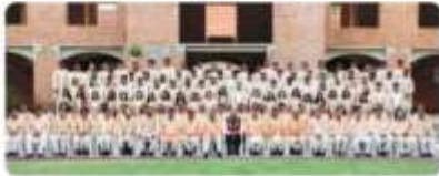
ईडीआइआइ के 25वें दीक्षांत समारोह में डिग्री देने वाले विद्यार्थी एवं अधिका

वे संस्थान की भारतीय उद्यमिता विकास संस्थान (ईडीआइआइ) के 25वें दीक्षांत समारोह को प्रशंसा और प्रारंभ पर से संबोधित कर रहे थे।