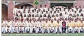
A total of 98 students graduated this year at EDI