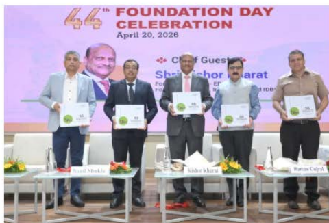
EDII Celebrates its 44th Foundation Day

Entrepreneurship Development Institute of India , Ahmedabad, marked its 44th Foundation Day on 20 April 2026 with a clear message: entrepreneurship remains central to India's growth story. The event also showed how the institute keeps linking training, mentorship, rural enterprise and policy work to support new business creation.