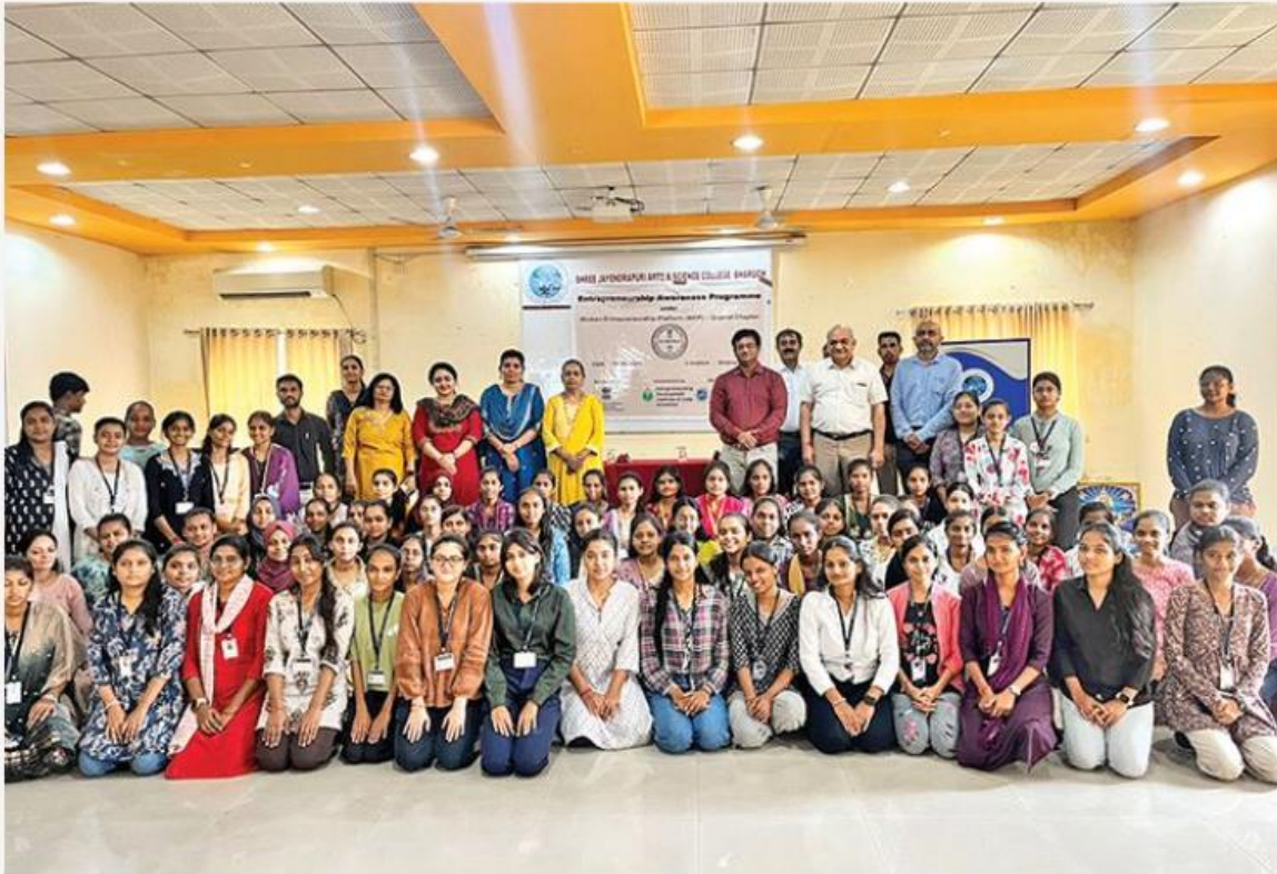
EDII's women entrepreneur initiative helps 900 women